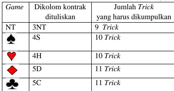
Tabel 2.5 Tabel Score Tidak Game menurut Iskandar, (2004: 10)