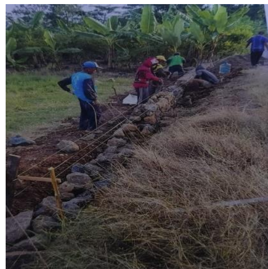
Gambar 2. Pasangan Batu Kali

Pada proyek ini tinggi pasangan batu kali terdapat 2 segment. Segment pertama yaitu setinggi 1,30 m dengan panjang 100.00 m dan segment kedua yaitu setinggi 1,40 m dengan panjang 159 m.