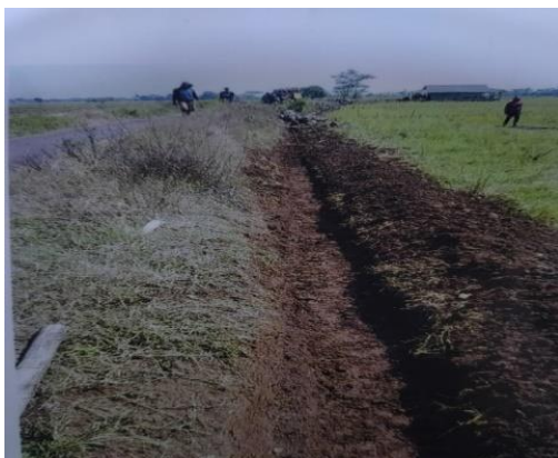
Gambar 1. Galian tanah

Pengukuran dilakukan pada tembok penahan tanah yang akan dibangun yang selanjutnya dilakukan pekerjaan galian.