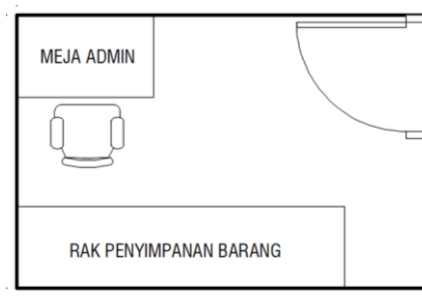
Gambar 1 Usulan Sketsa Layout Receiving Room Rusun Mahasiswa

Kebutuhan sirkulasi pada receiving room ini membutuhkan meja kerja untuk admin dari receiving room . Admin berfungsi sebagai perantara antara pihak luar rusun dan penghuni. Pihak luar ini adalah kurir paket atau orangtua/keluarga dari penghuni rusun mahasiswa. Admin akan mencatat administrasi penitipan barang yang datang, memungkinkan juga untuk penghuni rusun menitipkan barang untuk pihak luar. Sistem dari receiving room ini bisa mengeluarkan dana talang apabila pembeli yang bersangkutan tidak ada di lokasi alamat tujuan. Kemudian pada receiving room ini membutuhkan loker area untuk penyimpanan barang. Sketsa usulan layout dari receiving room dapat terlihat pada gambar 1: