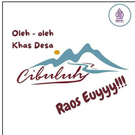
Logo UMKM Oleh-oleh Khas Desa Cibuluh