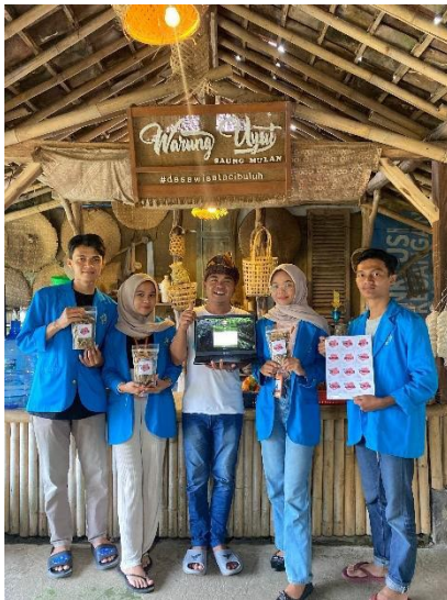
Serah terima logo oleh-oleh khas desa cibuluh dan website Linktree wisata desa cibuluh

Pembuatan Konten Promosi Wisata: Konten promosi yang dipublikasikan di media sosial berhasil menjangkau 25,8 ribu orang, menunjukkan keberhasilan strategi digital dalam meningkatkan popularitas wisata Desa Cibuluh. Dengan memanfaatkan media sosial dan platform kreatif @subang.info, upaya promosi ini efektif dalam memperbaiki penurunan kepopuleran wisata dan menarik lebih banyak perhatian dari audiens yang lebih luas. (Yulistiawan et al., 2024)