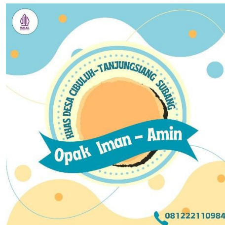
Logo UMKM Opak Iman - Amin