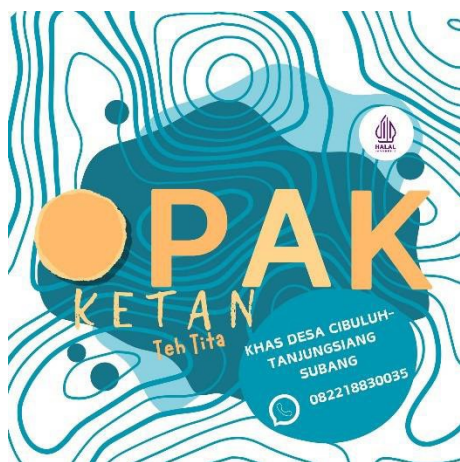
Logo UMKM Opak Ketan