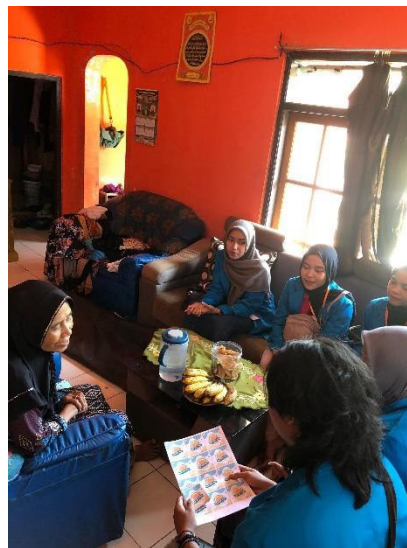
Serah Terima Logo UMKM Desa Cibuluh