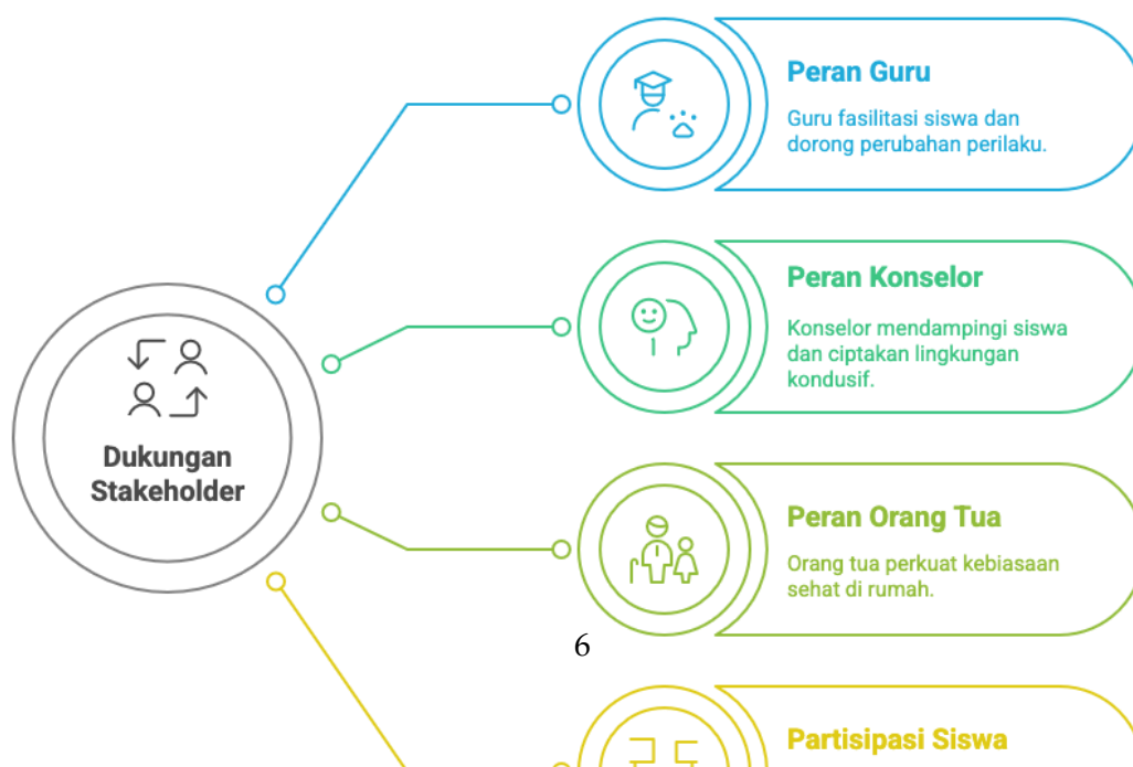
Gambar 2. Peran Aktif Stakeholder dalam Mendukung Keberlanjutan Program

Tabel 1 menunjukkan adanya peningkatan signifikan pada aspek kesehatan mental dan fisik remaja setelah mengikuti program senam mindfulness dan olahraga fungsional. Rata-rata skor konsentrasi meningkat sebesar 26,2%, sementara tingkat kecemasan menurun hingga 25,5%, menunjukkan dampak positif pada stabilitas emosional siswa. Secara fisik, terdapat peningkatan pada kekuatan otot dasar (21,9%), fleksibilitas tubuh (25,8%), dan postur tubuh saat berdiri (21,9%). Temuan ini mengindikasikan bahwa kombinasi kedua pendekatan tersebut efektif dalam mengoptimalkan kebugaran dan kesejahteraan psikologis remaja di era digital.