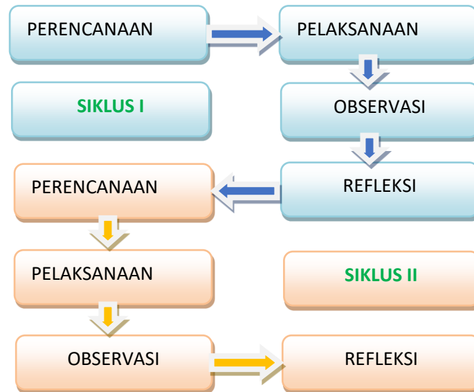
Gambar 1. Konsep Prosedur Penelitian

Konsep di atas bila diilustrasikan sebagai berikut: