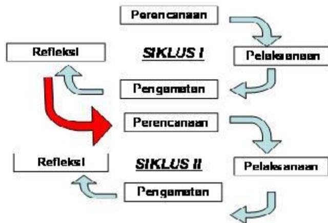
Gambar 2. Alur Prosedur Penelitian

Dalam penelitian tindakan kelas mencakup empat langkah, yaitu perencanaan, pelaksanaan tindakan, observasi, dan refleksi (Suharsimi Arikunto, 2008:75).