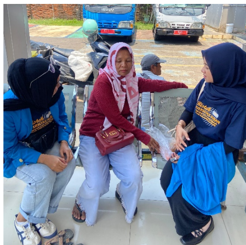
Gambar 1 Wawancara dengan Masyarakat

Metode yang digunakan dalam penelitian ini adalah metode penelitian deskriptif dengan pendekatan kualitatif. Penelitian ini bertujuan untuk menggambarkan secara mendalam penerapan aplikasi Identitas Kependudukan Digital (IKD) di Dinas Kependudukan dan Pencatatan Sipil (Disdukcapil) Kabupaten Subang. Pendekatan kualitatif dipilih karena memungkinkan peneliti untuk memahami fenomena yang terjadi di lapangan secara rinci dan mendalam, serta untuk mengeksplorasi berbagai faktor yang mempengaruhi proses implementasi aplikasi IKD di Disdukcapil. Pendekatan ini juga memfasilitasi peneliti dalam menggali persepsi, pengalaman, dan dinamika yang ada di antara pegawai dan masyarakat yang terlibat dalam penggunaan aplikasi tersebut.